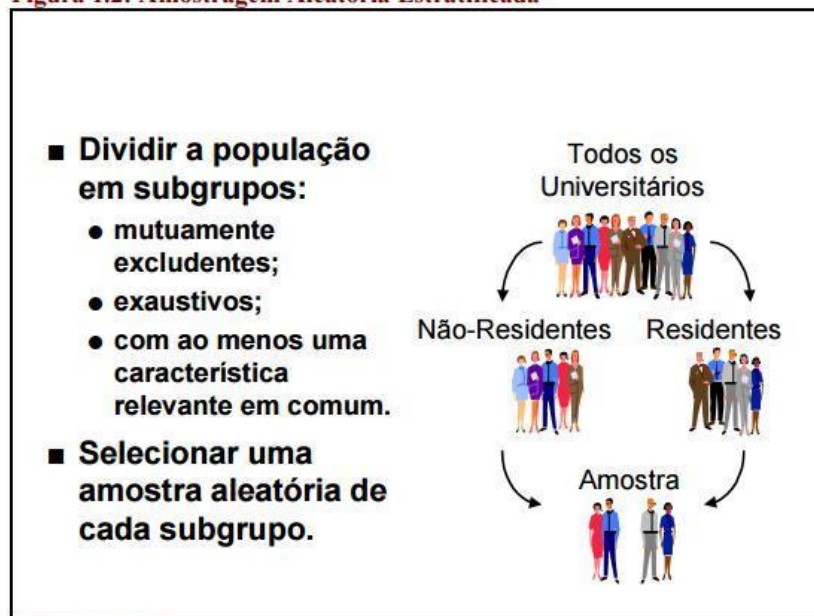
Figura 1.2: Amostragem Aleatória Estratificada

Na estratificação da população, cada elemento deve constar de um único estrato, ou seja, os estratos não podem possuir interseções, enquanto que o conjunto de elementos de um estrato deve ser o mais homogêneo possível em relação à característica que se pretende examinar, como ilustrado pela Figura 1.2.